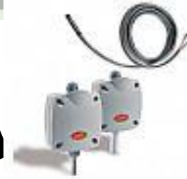
SONDAS NTC- Activa