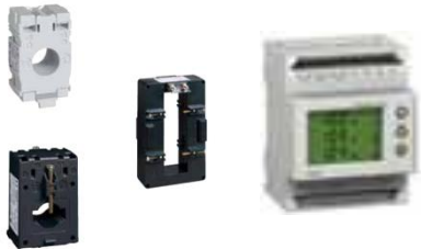
CONEXIÓN DE TOROIDALES AL EQUIPO