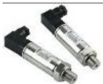
TRANSDUCTORES DE PRESIÓN